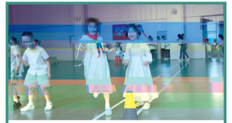
6月20日，南京市花港第一小学开展“独乐乐不如众乐乐”主题游园活动，让学生度过一个快乐、趣味、向上的节日，感受端午文化魅力熏陶。通讯员 蔡雨含 周弦 南京晨报/爱南京记者 李灿伦

如果你想改变现状，完善自己，就请一直学下去。趁着年轻，多看书，多参加活动，多出去看看世界，充实自己。请一定相信，所有的付出一定不会白费！南京晨报/爱南京记者 周卉卉